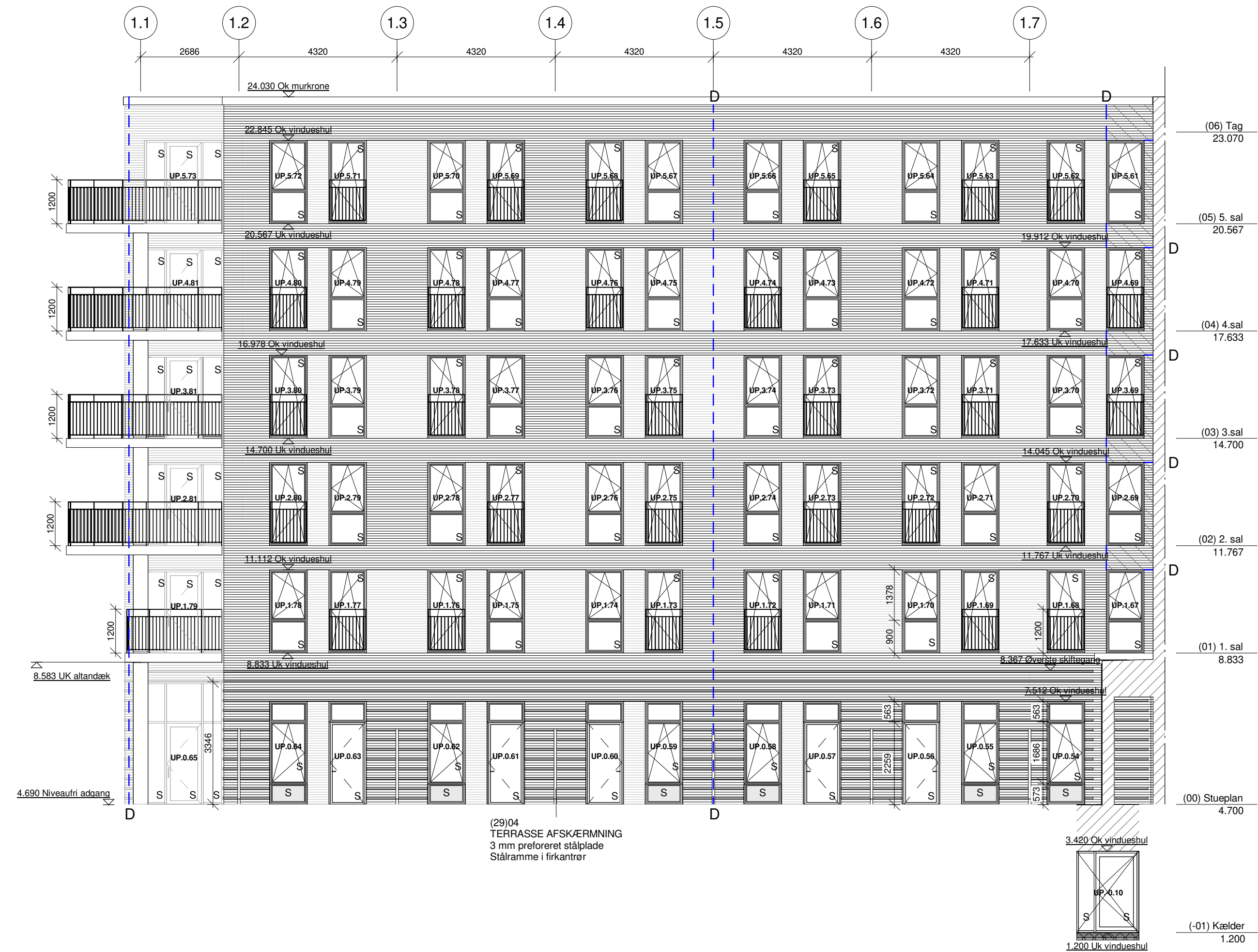
F8 - 1 : 100